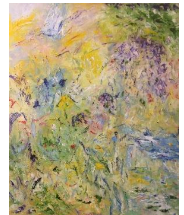
Hadewych – olie op doek